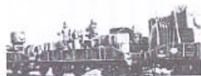
Эшелон с оборудованием завода «Красный Профинтерн» уходит на Восток

Завод «Красный Профинтерн» был эвакуирован в Красноярск, завод им. Кирова — в уральский город Усть-Катав, станки и оборудование вагоностроителей отправили в Энгельс за Волгу. На восток увозили турбины ГРЭС, оборудование сталъзавода. Удалось эвакуировать и часть предприятий из других городов Брянщины: Погарский сигарный комбинат — в Москву и Удмуртию, Клинцовскую текстильную фабрику им. Ленина — в Ульяновскую область, швейную фабрику — в Бузулук Оренбургской области. Какой огромный объем работы был выполнен брянцами в этой напряженнейший период времени, видно из таких данных: только для эвакуации «Красного Профинтерна»