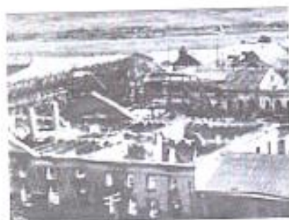
Разрушенные во время войны сооружения завода дорожных машин, Брянск, 1943 г.

С запада еще доносился удаляющийся грохот боев, а освобожденные из фашистского рабства брянцы с большим энтузиазмом приступили к восстановлению народного хозяйства и культуры края. Тысячи жителей городов и сел выходили на расчистку завалов, восстанавливали железнодорожные узлы, предприятия, жилые дома. К концу 1944 года удалось возродить 65 промышленных предприятий. Объем выпускаемой ими продукции составлял всего один процент от довоенного уровня. В 1945 году выпуск промышленной продукции составил 18 процентов.